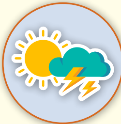
Estado de ánimo